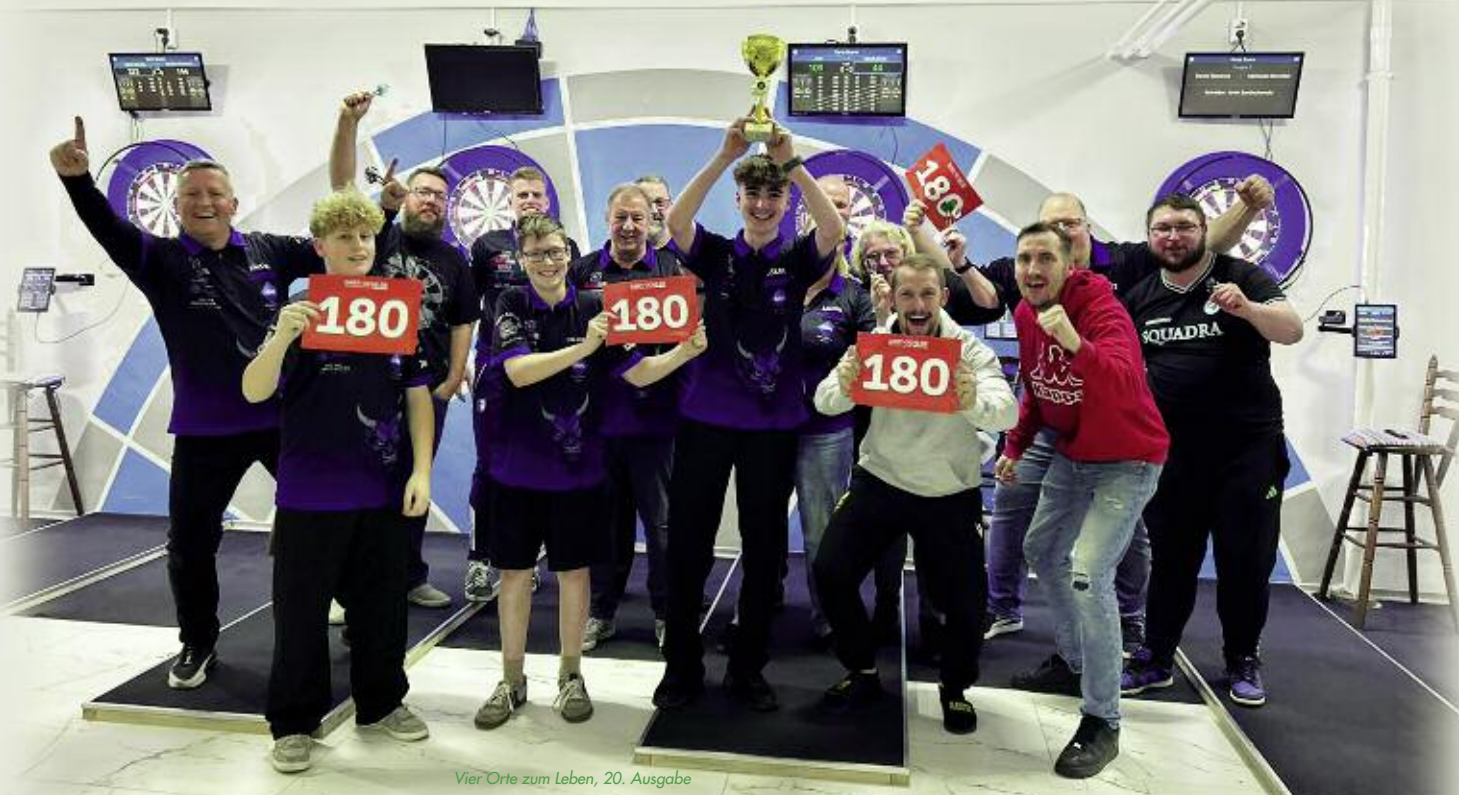
Vier Orte zum Leben, 20. Ausgabe

Blue Devils Rüdersdorf DC e.V. Kalkberger Platz 32 15 562 Rüdersdorf b. Berlin Tel. 01 79/4 25 66 42 www.bluedevilsdc.de