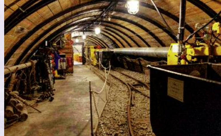
Neben Loks, Pumpen oder Bohrern sind in Schaukästen des Vereins viele Dinge mit Bezug zum Bergbau zu sehen.

„Wir sind in 50 Ländern der Erde vertreten.“