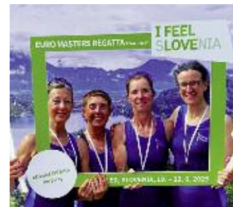
RRVK in Slowenien