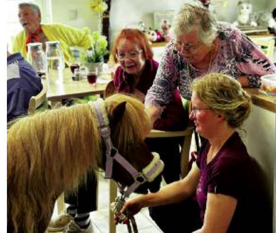
Besonders beliebt sind bei Tagesgästen und Besuchern die gemeinsamen Veranstaltungen.

Vier Orte zum Leben, 20. Ausgabe/Firmenporträt