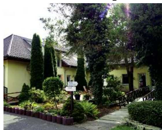
Die Wohngemeinschaft liegt in einer wunderschönen parkähnlichen Anlage.

Möchten Sie nicht nur im Grünen wohnen, sondern auch im Grünen arbeiten? In einer wunderschönen Wohngemeinschaft mit elf Einzelzimmer für Patienten, in mitten einer gepflegten Parkanlage? Dann sind Sie bei uns genau richtig! Wir suchen examinierte Pflegefachkräfte, zur Unterstützung unseres motivierten Teams, in unserer Wohngemeinschaft für Intensivpflegebedürftige Menschen in Dahlwitz-Hoppegarten bei Berlin – gerne in Voll- und Teilzeit. Es ist jeder herzlich eingeladen, sich von unserem professionellen und dennoch familiären Ambiente zu überzeugen. Wir bieten unseren Mitarbeitern und Mitarbeiterinnen viele individuelle Möglichkeiten, Vorzüge und eine