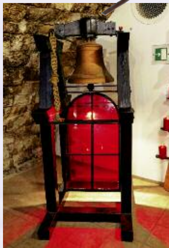
Diese Glocke vom Bethaus aus dem Heinitz Bruch ist durch den Ersten Weltkrieg, Zweiten Weltkrieg, DDR-Zeit – immer von einem Magazingebäude ins nächste geschoben worden und nun steht sie im Heinitztunnel.