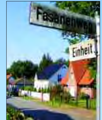
Der Stadtteil Stolpe-Süd seit dem Mauerfall keine Enklave, sondern beliebte Wohnadresse

plätze für Autos anbietet. Der neu gestaltete Dorfanger mit der kleinen, zur Zeit in Renovierung befindlichen Kirche ist ebenso sehenswert, wie ein erholsamer Spaziergang auf der Uferpromenade zum Museum