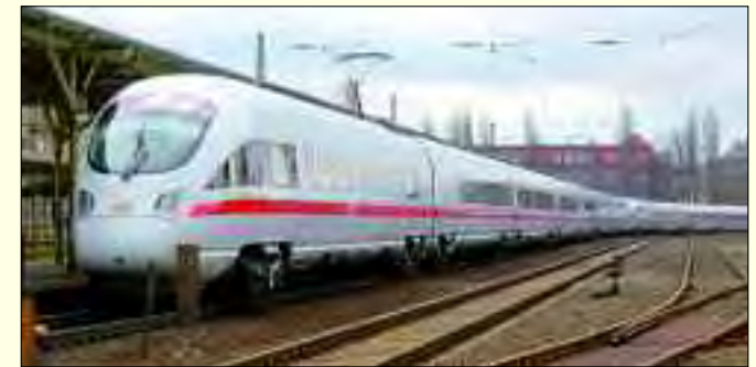
ADtrans Hennigsdorf entwickelte ICE-Züge mit Neigungstechnik

Berlin nach Hennigsdorf, doch 1961 mit dem Mauerbau wurde diese Verbindung rigoros ge-