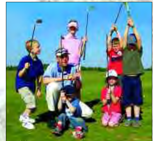
An zwei Tagen in der Woche werden sogar die „Kleinen“ professionell betreut

Ebenso stehen in Stolpe mit einer überdachten Driving Range mit 120 Abschlagsplätzen und Indoor-Videoanalyse, zwei Putting-Grüns und zwei Pitching-Grüns zahlreiche und großzügige Übungseinrichtungen zur Verfügung. Professionelle Anleitung zum Golfspiel erhalten die Golfer durch freundliche PGA-Golflehrer,