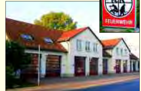
Im Dezember 2004 bezogen die Florianjünger ihr neues Depot in der Parkstraße

Im Jahr 2009 steht für die Hennigsdorfer Freiwillige Feuerwehr das 100. Jubiläum an. Ein Anlass, um in die Geschichte der Florianjünger zu schauen. Im Mai 1681 vernichtete eine Feuersbrunst große Teile von Hennigsdorf. 1840 gab es die erste Feuerlöschordnung, die alle Bewohner zum Feuerschutz verpflichtete. Ein Blitz äscherte 1852 die Kirche ein und 1917 gab es eine verheerende Explosion im Stahl- und Walzwerk. Großeinsatz für die 1909 gegründete Freiwillige Feuerwehr des Ortes, die 1928 neben dem alten Rathaus ein eigenes Depot erhielt. Nun heulen die Sirenen in der Parkstraße, wenn aus dem modernen Gerätehaus die Löschfahrzeuge, Leiter- und Gerätewagen ausrücken. Ob der Wald, Wohnungen oder Autos