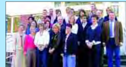
Das WGH-Team betreut seine Mitglieder und Mieter professionell

Als größtes Hennigsdorfer Wohnungsunternehmen, mit insgesamt 4.671 verwalteten Wohnungen, ist die Wohnungsgenossenschaft „Einheit“ bekannt für den hervorragenden Service. Die Wohnobjekte sind alle saniert und nach wie vor bezahlbar. Die in der Stauffenbergstraße 22a vorhandenen altengerechten