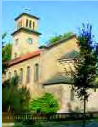
Die 1852-1855 erbaute Martin-Luther-Kirche im historischen Teil Hennigsdorfs

High-Tech-Zentrum und über die reizvolle Havellandschaft anbietet. Dazu geführte Stadtrundgänge oder im Sommer auch Dampferfahrten „Hennigsdorf vom Wasser gesehen“. Linker Hand beherbergt das 1998/99 liebevoll restaurierte Gebäude des alten Bahnhofs die Stadtbibliothek, die mit