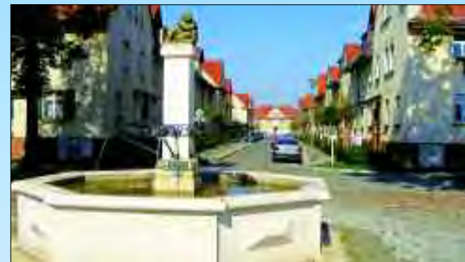
Der malerische Brunnen ist ein Schmuckstück der Wattstraße

Die Hauptstraße führt vorbei an den blauen futuristisch anmutenden Gebäuden von Bombardier und dem dahinter gelegenen Halbrund des Bio Technologie Centers. Am Stadtklubhaus in der Architektur der 50er mit seinen Events und Ausstellungen fällt der Blick auf den Brunnen an der Wattstraße. Am Waldpark vorbei führt nun die Spandauer Allee nach Nieder Neuendorf, wo am alten Strom die Naturbadestelle im Sommer hunderte Badelustige zu einem erfrischenden Bad in der klaren Havel einlädt. Es sich lohnt sich zum Yachthafen abzubiegen, wo