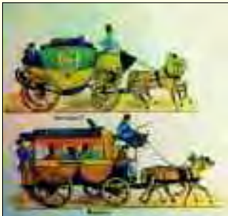
Postkutschen, wie sie auch von Berlin nach Hamburg führen

dem Jahr 1700 war die kurfürstliche Schiffswerft in Havelberg angesiedelt. Das blaue Band der