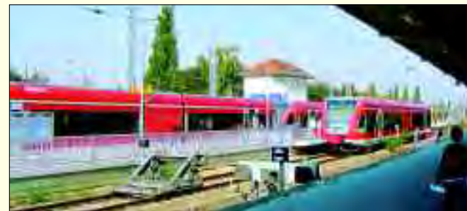
Der Bahnhof Hennigsdorf ist für viele Berlin-Pendler täglich bequeme Umsteigestation von den Regionalzügen in die S-Bahn

kappt und um in die Hauptstadt der DDR zu kommen, mussten die Pendler nun den Doppelstockzug auf dem Außenring nehmen. Erst seit Dezember 1998 verkehrt die S-Bahn wie-