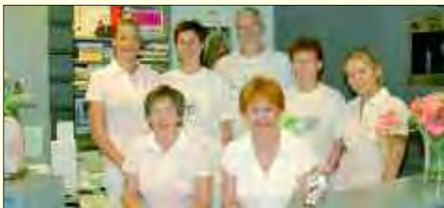
Das Praxisteam sorgt für gesunde und schöne Zähne – nur lächeln müssen Sie selber

Die Praxis orientiert sich am neuesten Stand der Technik. Unter anderem wird ein modernes, digitales und damit strahlungsarmes Groß- und