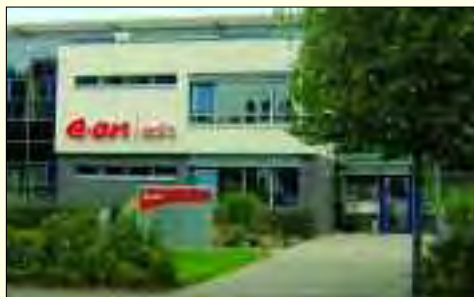
E.ON edis AG – Standort Hennigsdorf

Der Regionalbereich Oberhavelland der E.ON edis AG, mit den Standorten Hennigsdorf und Falkensee, betreut Einwohner auf einer Fläche von 1.500,08 Quadratkilometer mit 137.468 Zählern. Hinter diesen nüchternen Zahlen steht ein leistungsstarkes Unternehmen mit vielfältigen Dienstleistungen und einem funktionierenden Kundendienst. Rund um die Uhr sind Mitarbeiter von E.ON edis dienstbereit und helfen schnell und unkompliziert. In Hennigsdorf, in der Veltener Straße werden Privat-, Gewerbe- und Sonderkunden von erfahrenen Mitarbeitern betreut. Hier gibt es Beratung zu allen Fragen der Stromversorgung, zum Strompreis, zur Abrechnung und zum Energiesparen, beispielsweise durch das Aufspüren von „Stromfressern“ mit speziellen Geräten. Der Energiespardedektiv wird kostenlos an die Kunden ausgeliehen. Das Unternehmen ist darüber hinaus ein bedeutender Arbeitgeber und Ausbildungsbetrieb. Derzeitig sind an beiden Standorten 69 Mitar-