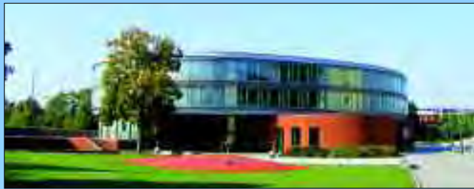
Seit 2004 Sitz der Stadtverwaltung, das neue Rathaus Hennigsdorf

Hennigsdorf schmiegt sich ans blaue Band der Havel und die Stolper Heide im Osten, wird im Westen von der Neuendorfer Heide und dem Krämer Wald eingeschlossen. Ein Paradies für Wanderer und Radler, für Wassersportler, Reiter und Naturliebhaber. Im Krämer Wald am Rande des Havelländischen Luches sind die Zwölf-Brüdereiche, der Moospfuhl, die Königseiche und das Forsthaus Krämerpfuhl beliebte Ausflugsziele. Und mit dem Boot gelangt man über Havel und Havelkanal bis zur Müritz und über den Oder-Havel-Kanal bis in die Ostsee. Aber auch die sich ständig verjüngende Stadt lädt zu einem Bummel ein. Vor dem S-Bahn- und Regionalbahnhof liegt der Postplatz über den man auf die Bummelmeile der