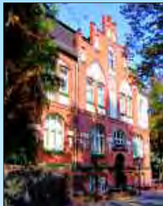
Altes Rathaus - Standesamt, Ausstellung und Stadtarchiv

Hennigsdorf schmiegt sich ans blaue Band der Havel und die Stolper Heide im Osten, wird im Westen von der Neuendorfer Heide und dem Krämer Wald eingeschlossen. Ein Paradies für Wanderer und Radler, für Wassersportler, Reiter und Naturliebhaber. Im Krämer Wald am Rande des Havelländischen Luches sind die Zwölf-Brüdereiche, der Moospfuhl, die Königseiche und das Forsthaus Krämerpfuhl beliebte Ausflugsziele. Und mit dem Boot gelangt man über Havel und Havelkanal bis zur Müritz und über den Oder-Havel-Kanal bis in die Ostsee. Aber auch die sich ständig verjüngende Stadt lädt zu einem Bummel ein. Vor dem S-Bahn- und Regionalbahnhof liegt der Postplatz über den man auf die Bummelmeile der