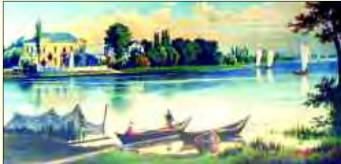
Kolorierter Stich – Hafelidyll am Fährhaus Heiligensee

Und dennoch profitiert die Stadt nordwestlich Berlins von seiner exzellenten Lage. Da ist nicht nur die Nähe des Autobahnringes und des Flughafens Tegel, die S-Bahnverbindung nach Berlin und die Regionalexpressstrecken, auch die Havel-Oder-Wasserstraße und der Havelkanal sichern Mobilität in alle Himmelsrichtungen.