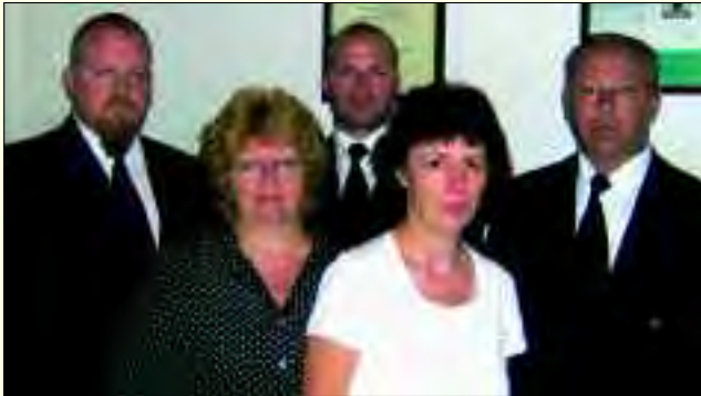
Für eine seriöse und würdevolle Bestattung der Verstorbenen steht das Bestattungshaus Döhnert

Das Leben ist ein Weg im ständigen Auf und Ab, geprägt von Liebe und Trauer, von Freude und Not, mit nur einem Ziel, seinem scheinbaren Ende, dem Tod. Doch er ist nur die Brücke in die Ewigkeit. Jeder Mensch hat ein Recht darauf, diese Brücke in Ehren und mit Würde zu überqueren. Diese Ehre dem geliebten verstorbenen Menschen zukommen zu lassen, darum kümmert sich das Bestattungshaus Döhnert. Sie garantieren im Todesfall eine seriöse und würdevolle Bestattung.