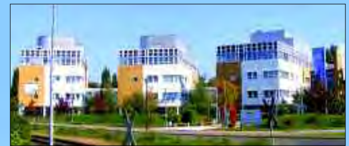
Im Sommer 1998 wurde im Gewerbegebiet Süd 1 der Grundstein für ein modernes Bio Technologie Zentrum in Hennigsdorf gelegt

das pittoreske Wohnquartier der Grenzturnes. Den Ausblick über den Nieder Neuendorfer See