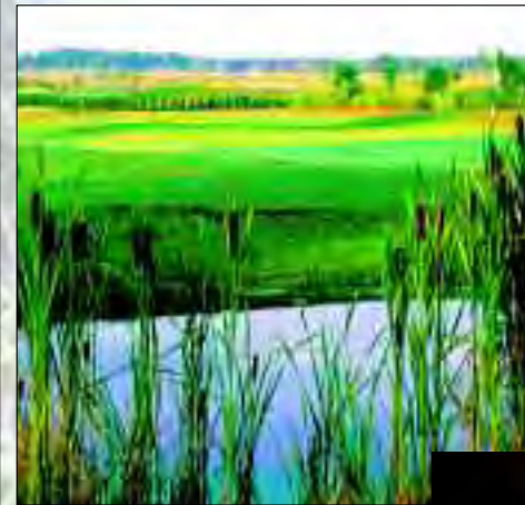
Der Platz ist wunderschön gestaltet

Kurz vor den Toren Hennigsdorfs gelegen, befindet sich inmitten der Stolper Heide die wunderschöne und sportlich attraktive 36-Loch-Golfanlage mit großzügigen Übungseinrichtungen und einem Sechs-Loch-Golfplatz für jedermann. Der 1997 eröffnete Westplatz ist ein Meisterstück im Design des erfolgreichen deutschen Golfers Bernhard Langer. Der 2003 eröffnete Ostplatz, von Kurt Rossknecht geplant und verwirklicht, besticht durch markante Grasmulden, große Bunker, dichtes Rough und besonders schnelle Grüns. Er verlangt präzises Spiel und spornt so zu Höchstleistungen an. Aber keine Angst – auch für Golfeinsteiger sind die Plätze gut zu bewältigen.