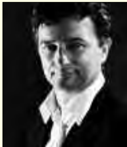
Foto Atelier Nikolai Havelpassage 13 • 16 761 Hennigsdorf Tel. 0 33 02/49 34 35 www.foto-nikolai.de • www.bild-von-oben.de