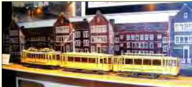
Maßstabgetreues Modell der Straßenbahnlinie 120, wie sie in den 20er Jahren zwischen Spandau-West und Hennigsdorf verkehrte

Havel war eine wichtige Transportader auch in Preußens Metropole. Nicht umsonst heißt es,