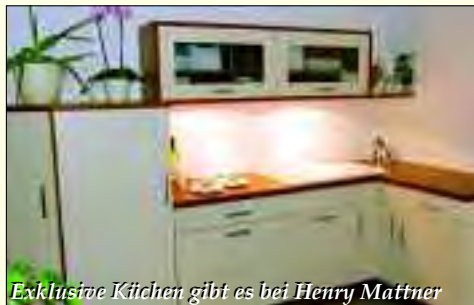
Exklusive Küchen gibt es bei Henry Mattner

Die Firma wurde im November 1992 gegründet. Seit nunmehr 15 Jahren ist sie mit Sitz in Nieder-Neuendorf, erfolgreich im Küchengeschäft tätig. In diesem Zeitraum wurden an die 3.000 Küchen montiert. Anfangs als Montagebetrieb, machte sich die Firma in Berlin/Brandenburg und über dessen Grenzen hinaus einen Namen. So war Henry Mattner bereits in Addis Abeba tätig. Auch bei renommierten Berliner Möbelhäusern und der Berliner Messe (Grüne Woche, Reha Messe) findet man seine Firma Jahr für Jahr. Die Beratung, die Planung, der Verkauf und die Montage erfolgen heute bundesweit und immer aus einer Hand. Starke Handelspartner an seiner Seite sind die Firma Leicht, Format-Küchen, Miele und Villeroy & Boch. In den letzten Jahren wurde das Angebot in Richtung behindertengerechte Küchen und Küchen für Senioren und Kleinwüchsige erweitert. Damit können diese Menschen in ihrer gewohnten Umgebung verbleiben. Die erste Beratung erfolgt vorwiegend beim Kunden zu Hause. Vor Ort wird ein millimetergenaues Aufmaß erstellt, und auch schon erste