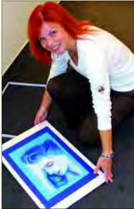
Sensible und sehr farbinensive Frauenporträts sind ein beliebtes Motiv der Freizeitmalerin

Unter ihnen in der kleinen Galerie auf Zeit war auch eine junge, introvertierte Frau mit einem feuerroten Haarschopf, die interessiert zuhörte, um nicht zu sagen lauschte ohne sich zu erkennen zu geben, was die Besucher so über ihre Bilder zu sagen hatten. Sie ist, was man so landläufig eine Wochenendmalerin nennt, Cor-