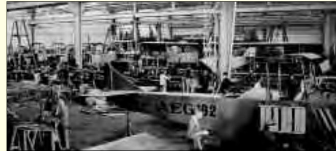
1918 verließen täglich sechs Flugzeuge die AEG-Werke Hennigsdorf

Auch Schrott und Zuschlagstoffe wurden auf dem Wasserweg ins 1917 erbaute Stahl- und Walzwerk gebracht, das 1948 nach dem Wiederaufbau den ersten Stahlabstich feierte und seit 1992 zum italienischen RIVA-Konzern gehört.