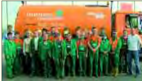
Das engagierte Team kümmert sich um das Erscheinungsbild der Stadt Hennigsdorf