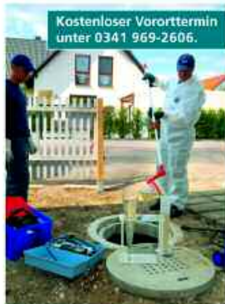
Regelmäßige Wartungen sichern die Funktion biologischer Abwasseranlagen – und sind gesetzlich vorgeschrieben.

KWL – Kommunale Wasserwerke Leipzig GmbH