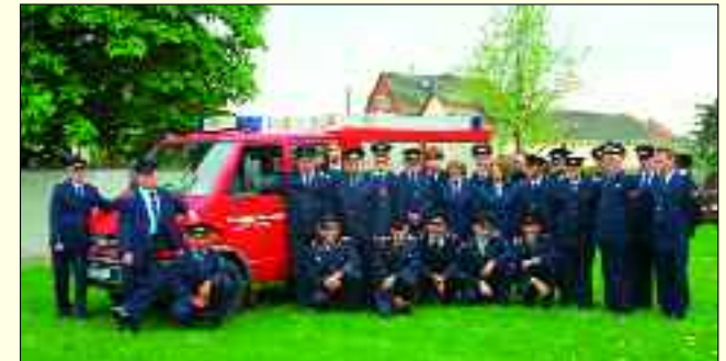
Die Kameraden der Freiwilligen Feuerwehr Kleinpösna mit ihrem Kleinlöschfahrzeug.

sich erfüllt, auch die nach der Motorspritze. Zwei Jahre nach ihrer Gründung nahmen die Kameraden stolz ihre erste Motorspritze vom Typ TS 8 in Empfang.