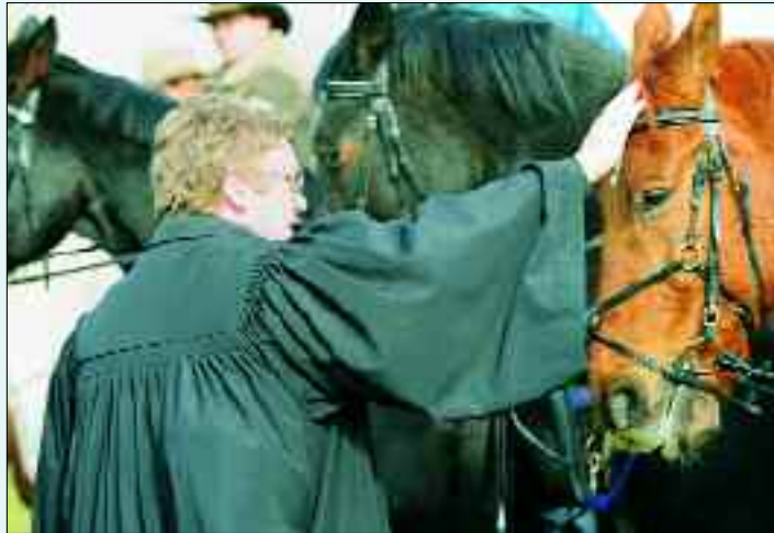
Segnung der Teilnehmer am Hirschfelder Osterritt

Jedes Jahr legen die Organisatoren eine andere etwa 25