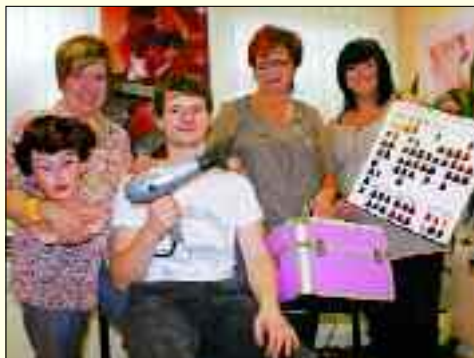
Salon Jungnickel bietet Haarscheidekunst im Viererpack