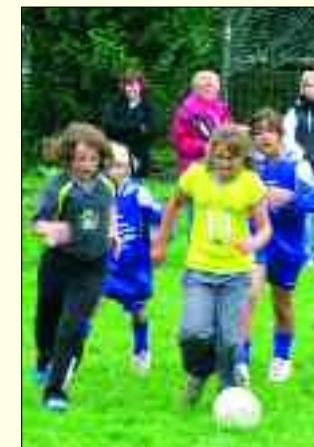
Kampf um jeden Ball bei der Mini-WM der Mädchen.