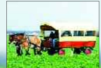
Mit dem Kremser durch die Heimat im Leipziger Land

Auch am Samstag vor Ostern des Jahres 2011 werden die Hirschfelder Osterreiter wieder ihre Pferde satteln und sich sowie die Tiere schmücken. Diesmal geht es in Richtung