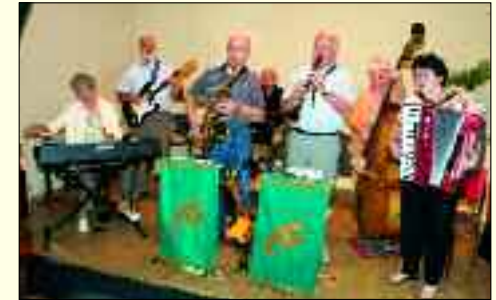
Die Evergreencombo der Aktiven Senioren

An einem Tag in der Woche bewegen sich die Frauen der rhythmischen Gymnastik in der Mehrzweckhalle. Gleich danach haben die Teilnehmer der Sportwerbegruppe ihre Trainingszeit. Auf der Kegelbahn rollen die Kugeln und in der Studio-bühne lauschen Interessenten einem Kunstvortrag. So geht es bereits seit fast 20 Jahren im Verein der Aktiven Senioren Leipzig zu. Die über 1000 Mitglieder engagieren sich in Sprachkursen, Computerkursen, in Leipzigs Schwimmhallen, auf Wanderungen quer durchs Umland oder bringen mittels Pinsel und Farbe große oder kleine Kunstwerke aufs Papier. Die Kultur- und Bildungsangebote zeigen sowohl Dynamik als auch Bestand. Manches hat sich überholt, anderes etablierte sich im Verein. So stellen beispielsweise die Kabarettisten „Die Unverbesserlichen“ 13 Programme vor. Ihre