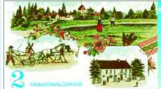
Aus der krisensicheren Baalsdorfer Dorfmark wurde der Dorfeuro.

Die Geschichte des kleinen Angerdorfes am östlichen Rand der modernen sächsischen Metropole Leipzig ist bewegt. Kann man den Notizen in alten Familienchroniken und Pfarrarchiven glauben, so hatte der Ort mit allem, was dazu gehört, im Laufe seiner fast 800-jährigen Geschichte mehr als 10 Besitzer. Schon einmal im 16. Jahrhundert gehörte Baalsdorf zu Leipzig. Wahrscheinlich schweren Herzens trennte sich damals der Rat zu Leipzig von dem schmucken Dorf, um 500 Scheffel Korn bezahlen zu können. Nun ist Baalsdorf schon seit 1999 ein echter Leipziger Ortsteil nachdem die Stadt regelrecht „aus den Nähten platzte“ und selbst Ortskundigen der Übergang von Stadt zu Dorf nicht mehr auffiel. Die Baalsdorfer haben sich jedoch immer als „Baalsdorfer“ gefühlt, gleichgültig, in wessen Besitz sich gerade das Angerdorf befand. Sie sorgten für ihr schönes Dorf, schützten die Höfe vor den Brandschatzungen zur Völkerschlacht und kümmerten sich um die Erhaltung der