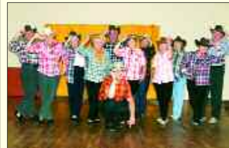
Spaß an Bewegung: die Line-Dancer

werden sehenswerte Einrichtungen in Leipzig und der näheren Umgebung vorgestellt. Alle diese Angebote verfolgen das Ziel, den Bedürfnissen der Senioren zu entsprechen. Das heißt, soziale Kontakte zu knüpfen, verborgene Talente zu wecken und zu fördern oder ganz einfach Freude und Frohsinn auch im Alter zu finden und zu erhalten sowie ein Stück Lebensqualität zurückzugewinnen. All das fand in den vergangenen Jahren auch überregional durch Auszeichnungen der Stadt Leipzig und des Landes Sachsen große Anerkennung.