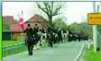
Der Passionsritt in Hirschfeld

In Zeiten, in denen kommunale Zusammenschlüsse per Dekret oft gegen den Willen der Bürgerschaften geschmiedet werden, kann es passieren, dass Argwohn zwischen kleinen Kommunen aufkeimt. „Pro Hirschfeld“, ein ganz besonderer Verein, hat darum eine tolle Idee entwickelt. „Mit unserem Osterritt wollen wir gerade den ortverbindenden Charakter zwischen unseren Nachbardörfern versinnbildlichen.