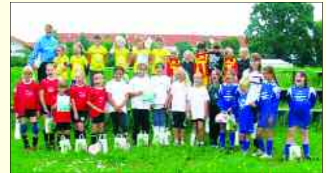
Gewonnen haben bei der Mini-WM in Engelsdorf eigentlich alle.

Da der sportliche Vergleich als Mini-WM-Turnier auf dem Programm stand, gaben sich die Mannschaften Ländernamen. Die Mädchen aus der 74. Grundschule aus Anger-Crottendorf starteten für Brasilien. Die Mannschaft vom SV Lok Engelsdorf trat für Spanien an. Schülerinnen aus der Brüder-Grimm-Schule waren die Mexikanerinnen. Aus der Regenbogenschule Taucha kamen die Argentinierinnen und für Italien spielten die Mädchen aus der Sommerfelder Schule für Lernförderung. Doch bevor die Mannschaften gegeneinander antraten sorgte Nadja Beck vom Deut-