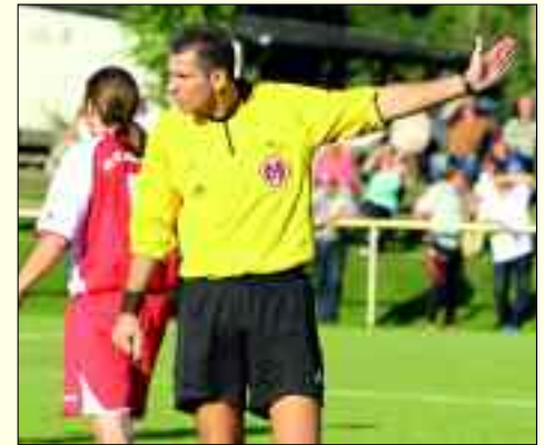
... und weiß immer wo es im Spiel lang geht!

Wenn einer die „Abseitsregel“ erklären kann, dann er. Er ist gar nicht der Schiedsrichter mit den großen Gesten. Er ist eher ruhig auf dem Platz, aber zugleich sehr dem runden Leder hinterher. Genau aus diesem Grund weiß er nur zu gut, wie