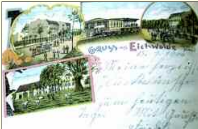
Solche kleinen Schätze sucht der Heimatverein, um sie aufzuarbeiten und anschließend der Öffentlichkeit zugänglich zu machen

eines eigenen Heimatfestes. Es ist ein kleines aber feines Fest, das Eichwalde in seinem Charakter eines ruhigen Vorortes der Stadt Berlin wiedergibt. Eine sehr interessante Geschichte verbindet sich mit diesem Fest, das jährlich am ersten Juniwochenende in Eichwalde gefeiert wird. So erzählt Wolfgang Flügge vom Heimatverein, „dass der Ursprung im damals gern gefeierten Erntedankfest liegt. Aus diesem Erntedankfest wurde das damals hinlänglich bekannte Volksfest. Doch 1938 nannte man es um und huldigte einer Pflanze im Ort, die ebenso wichtig und bedeutend ist, wie die Eiche, die dem Ort auch den Namen gab und das Ortswappen bestimmt.“ Diese zweitwichtigste Pflanze ist die Rose, die bis heute in vielen Vorgärten und Plätzen der Gemeinde zu finden ist. Ein Beispiel ist dabei