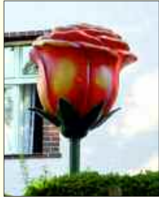
Die Rose gab dem Heimatfest des Vereins den Namen – dem Künstler S. A. Dott stand sie Modell

Geschichte und Geschichten auffinden, sie aufzuschreiben, sie zu dokumentieren, Daten und Bildmaterial zu sammeln, diese zu archivieren und sie dann schließlich auch der Öffentlichkeit zugänglich zu machen, das sind wesentliche