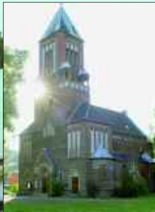
Ein Wahrzeichen der Gemeinde Eichwalde ist unumstritten die Katholische Kirche