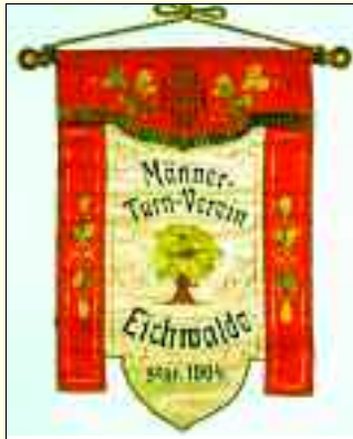
Der Wimpel des Männer-Turn-Vereins aus dem Jahr 1904

Überblick über die sportliche Entwicklung der Gemeinde Eichwalde. Das Heft beinhaltet ein Stück Heimatgeschichte und ist jedem Eichwalder und jedem Interessierten unbedingt zu empfehlen.