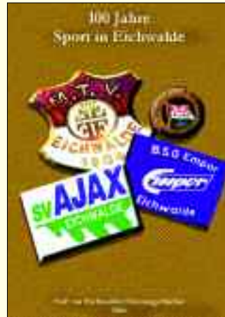
Das ist sie – die beliebt Eichwalder Vereinschronik

Das Heft beginnt, so wie auch die Vereinsgeschichte mit den