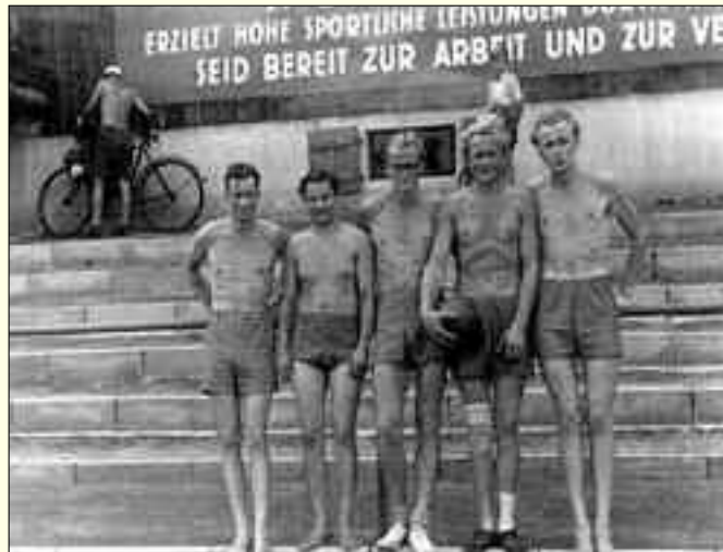
Die Mitglieder der Abteilung Faustball im Jahr 1952

graf erstellt, erzählt heute von Entwicklung, der Arbeit im Verein und dem Vereinsleben des SV Ajax Eichwalde. Und genau diese Broschüre, 83 Seiten stark, gibt einen sehr guten Ein- und