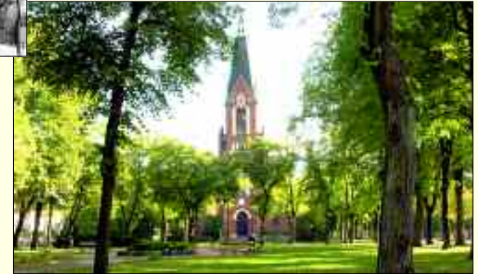
Die evangelische Kirche damals und heute

erschieden. Er zeigt, kaum beachtete und häufig schnell übersehene Besonderheiten von Eichwalde. Details, die eventuell jeder kennt, aber leicht übersieht. Der Verkaufspreis beträgt 6,80 Euro, und wer dieses kleine Kulturgut erwerben will, erhält ihn in der Buch-