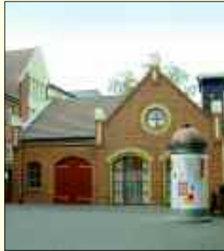
Die Alte Feuerwache dient als Kulturzentrum, das auch vom Heimatverein genutzt wird

und wachgehalten wird ihnen auch zugute kommen soll. Hierzu hierzu zählen sämtliche Maßnahmen, wie die Vorbereit-