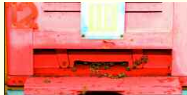
Geschäftiges Treiben am Flugloch – solange es warm genug ist