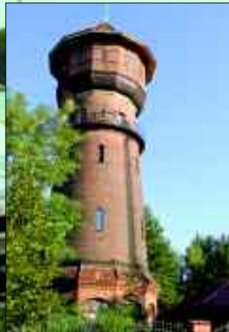
Der Wasserturm, 1913 gebaut, nach dem 2. Weltkrieg still gelegt ist heute ein Einfamilienhaus

Die Sportvereine dagegen fordern zum aktiven mitmachen oder anfeuern. Die Vereinslandschaft hat jedoch nicht ausschließlich Sportveranstaltungen zu bieten. So kann man zum Beispiel dem Hundeverein oder der Feuerwehr einen Besuch abstatten. Auf der offiziellen Internetseite der Gemeinde www.eichwalde.de kann aktuell nachgelesen werde, was gerade im Ort los ist.