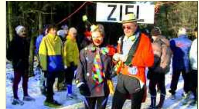
Beim Neujahrslauf herrscht immer ausgelassene Stimmung

nach und nach normalisierte sich auch in Eichwalde das Leben wieder und aus der eher losen Sportgruppe wurde die Sportgemeinschaft Ajax Eich-