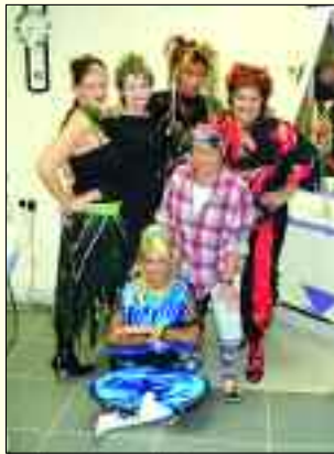
Das Team der Zeuthener Salon Margit Filiale beim jährlichen Mitternachtsfrisieren

beck gemeinsam mit ihren 16 Friseurinnen für sportliche, klassische oder freche Frisuren. Mit ständigen Weiterbil-