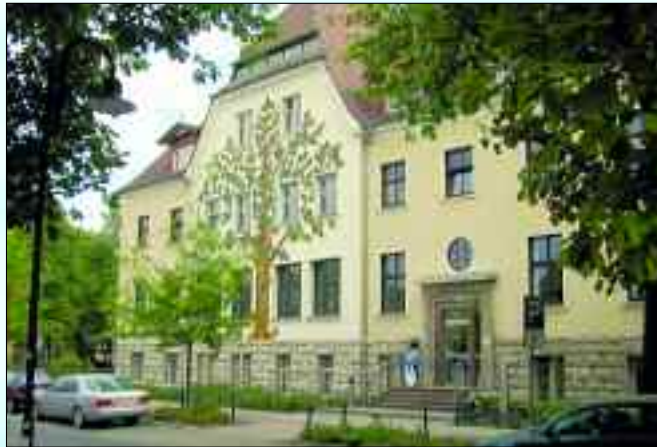
Das Rathaus mit der aus Kacheln zusammengesetzte Eiche

Das ist dem Ort jedoch nicht anzumerken. Im Gegenteil, die