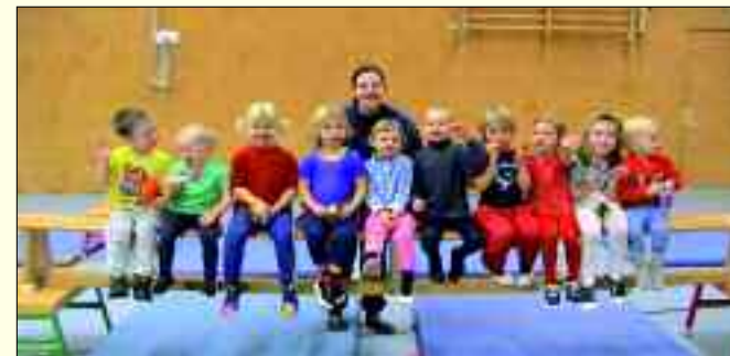
Schon die kleinsten-Eichwalder sind begeisterte Sportler