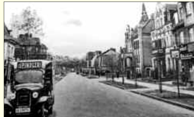
Die Bahnhofstraße Anfang des 20. Jahrhundert und heute