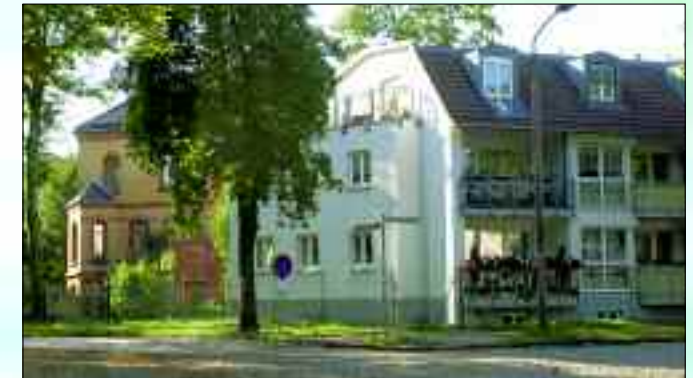
Neben den Villen aus der Gründerzeit wurde im Ort viel neu gebaut

walde besitzt nicht zuletzt wegen der großzügigen Alleen und den gepflegten Gärten eine Anziehungskraft, welche den Ort ständig wachsen lässt. Die Vorstadt-Romantik hat sich der Ort, welcher direkt vor den südlichen Toren Berlins liegt über die Jahre erhalten können. Wahrscheinlich sind es auch diese Attribute die Eichwalde zu einem Ort der Künstler und deren Schaffen geworden ist. Die gute Luft, die Nähe zum Wasser, die urigen Wälder ringsum und doch die Sicherheit in kürzester Zeit die Großstadt erreichen zu können hat viele kreative Köpfe angelockt. Der Begriff Tourismus ist heute in aller Munde. Selbstverständlich auch in Eichwalde. In diesem Bereich arbeiten die Gemeinde, ortsansässige Vereine und Firmen sowie engagierte Bürger im Bereich der Touristenwerbung Hand in Hand. Großer Wert wird ebenfalls auf eine ansprechende Darstellung der örtlichen Sehenswürdigkeiten, den Schutz und